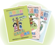
体験活動ガイドブック